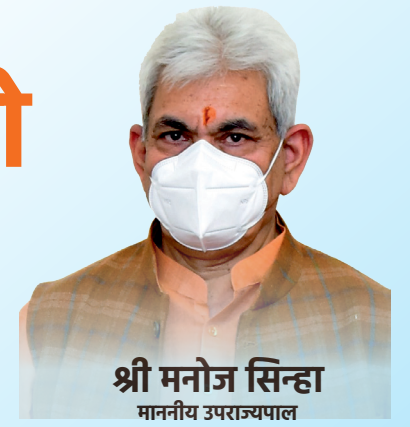
श्री मनोज सिन्हा माननीय उपराज्यपाल

हम सब मिलकर कोरोना वायरस से लड़ सकते हैं